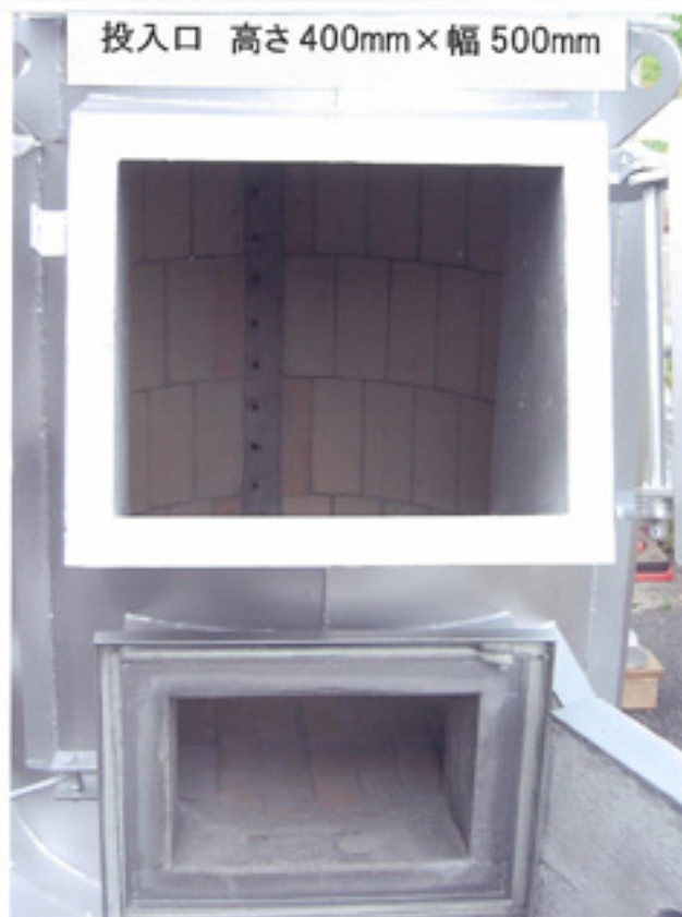
投入口 高さ 400mm×幅 500mm